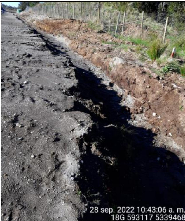
Fotografía N°31: Estado canales aguas lluvias