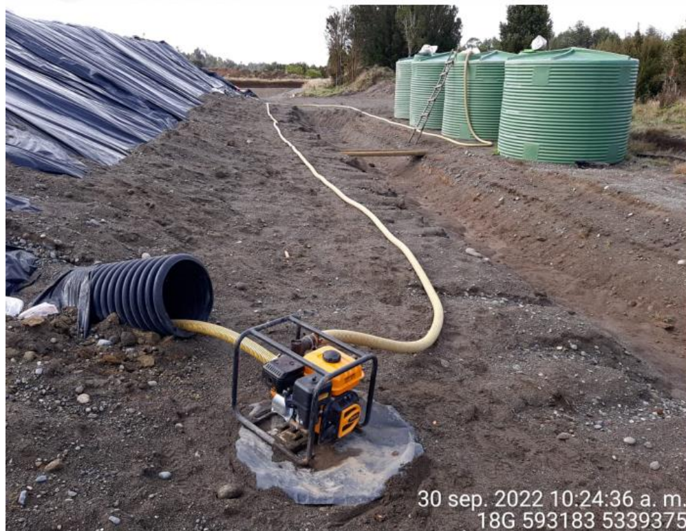
Fotografía N°7: Extracción de Lixiviados desde diagonal D2 Tomada: Viernes 30 de Septiembre del 2022.