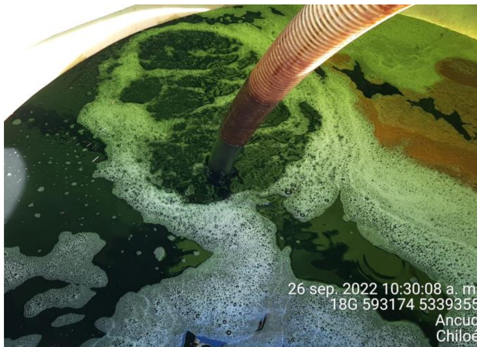
Fotografía N°2: Extracción de Lixiviados a estanque por personal municipal. Tomada: Lunes 26 de Septiembre del 2022.