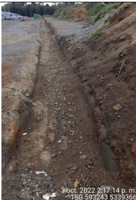
Fotografía N°23: Medición de Niveles de cámaras por Personal Municipal. Tomada: 03 de Octubre del 2022.