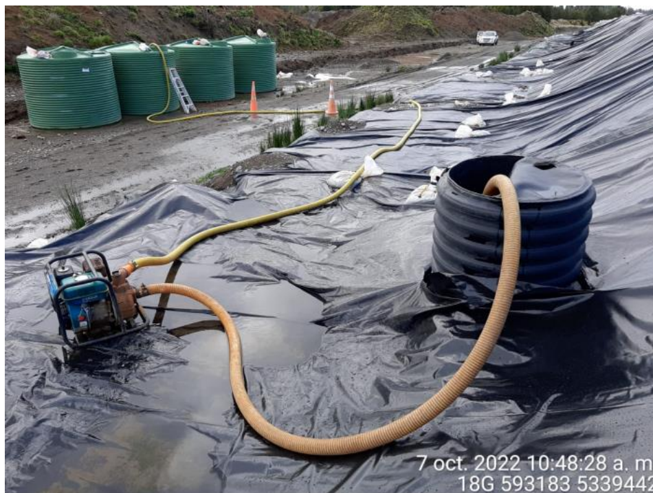
Fotografía N°14: Extracción de Lixiviados desde cámara C12 por personal municipal. Tomada: Viernes 07 de Octubre del 2022.