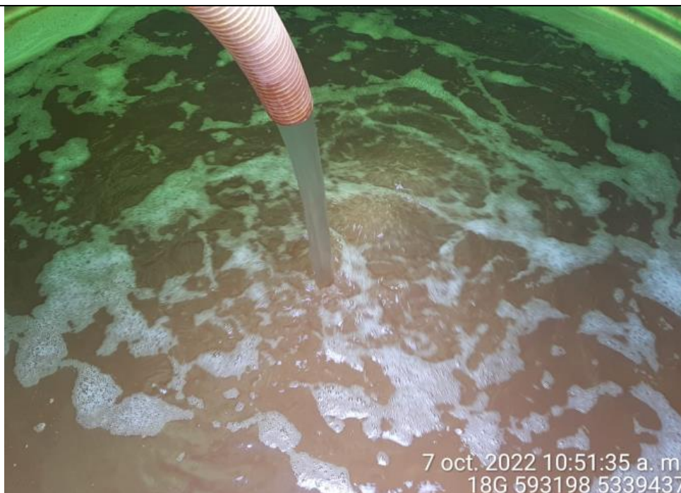
Fotografía N°15: Extracción de Lixiviados a estanque. Tomada: Viernes 07 de Octubre del 2022.