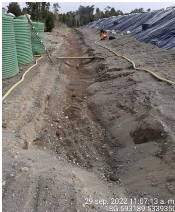
Fotografía N°32: Estado canales aguas lluvias