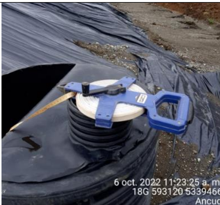
Fotografía N°26: Medición de Niveles de cámaras por Personal Municipal. Tomada: 06 de Octubre del 2022.