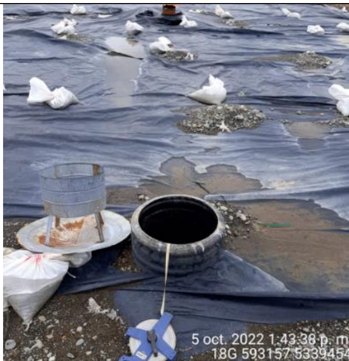
Fotografía N°25: Medición de Niveles de cámaras por Personal Municipal. Tomada: 05 de Octubre del 2022.