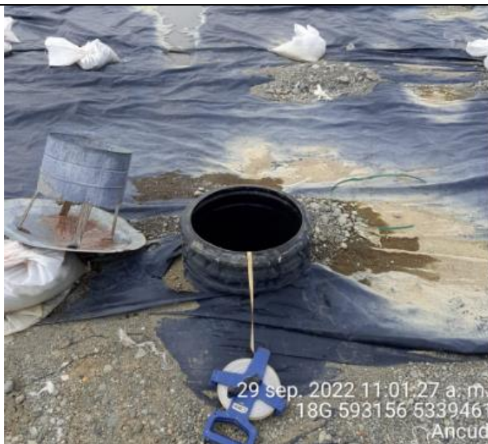
Fotografía N°20: Medición de Niveles de cámaras por Personal Municipal. Tomada: 29 de Septiembre del 2022.