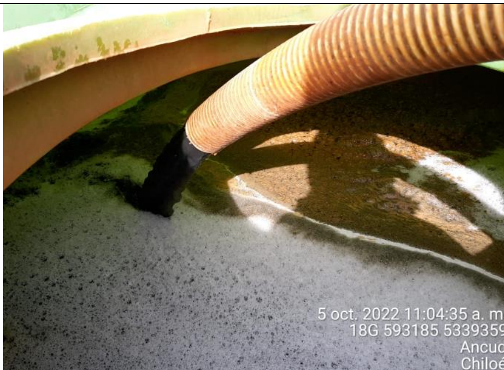
Fotografía N°13: Extracción de Lixiviados a estanque. Tomada: Miércoles 05 de Octubre del 2022.