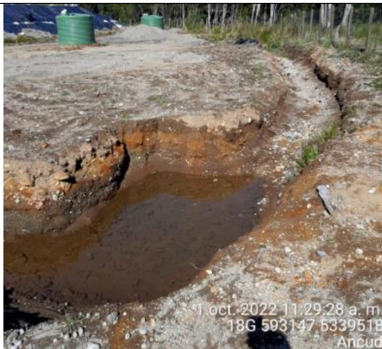
Fotografía N°34: Estado canales aguas lluvias