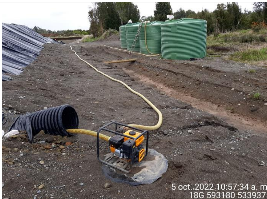
Fotografía N°12: Extracción de Lixiviados desde diagonal D2 Tomada: Miércoles 05 de Octubre del 2022.