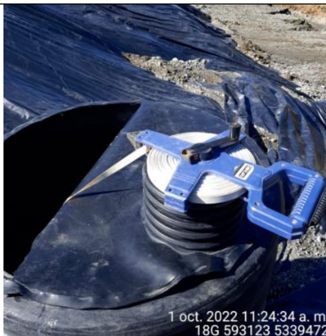
Fotografía N°22: Medición de Niveles de cámaras por Personal Municipal. Tomada: 01 de Octubre del 2022.