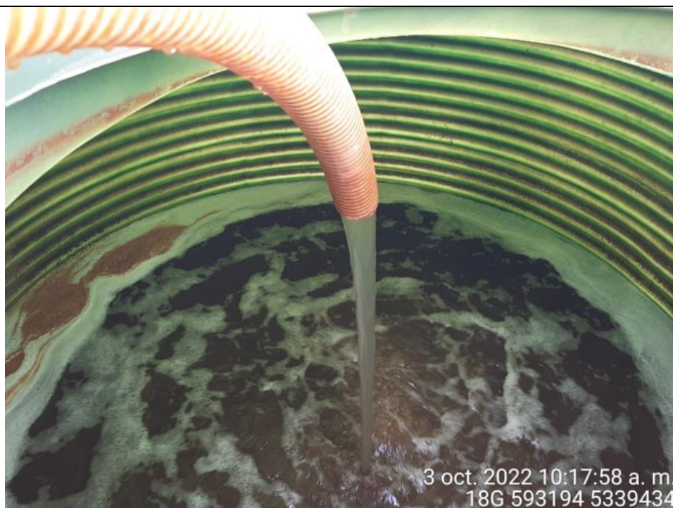
Fotografía N°11: Extracción de Lixiviados a estanque. Tomada: Lunes 03 de Octubre del 2022.