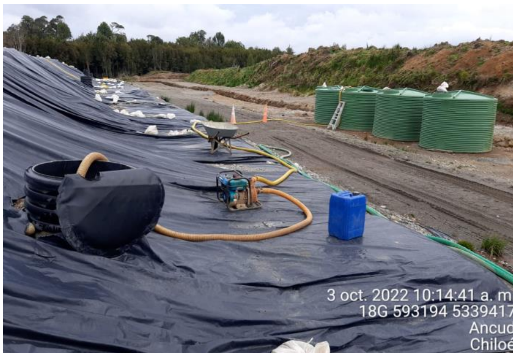
Fotografía N°10: Extracción de Lixiviados desde cámara C13 por personal municipal. Tomada: Lunes 03 de Octubre del 2022.