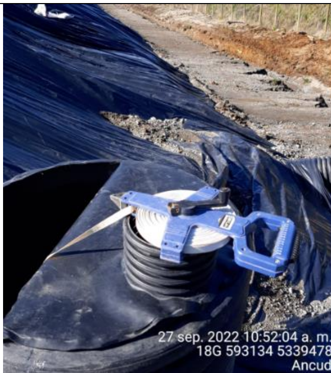
Fotografía N°18: Medición de Niveles de cámaras por Personal Municipal. Tomada: 27 de Septiembre del 2022.