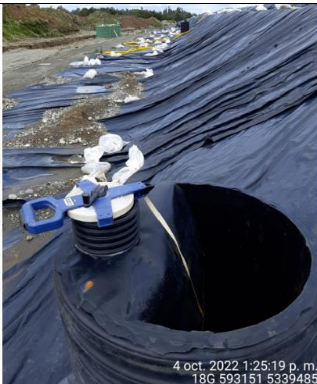
Fotografía N°24: Medición de Niveles de cámaras por Personal Municipal. Tomada: 04 de Octubre del 2022.