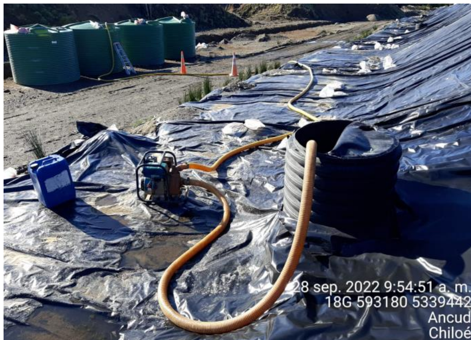
Fotografía N°4: Extracción de Lixiviados desde cámara C12 por personal municipal. Tomada: Miércoles 28 de Septiembre del 2022.