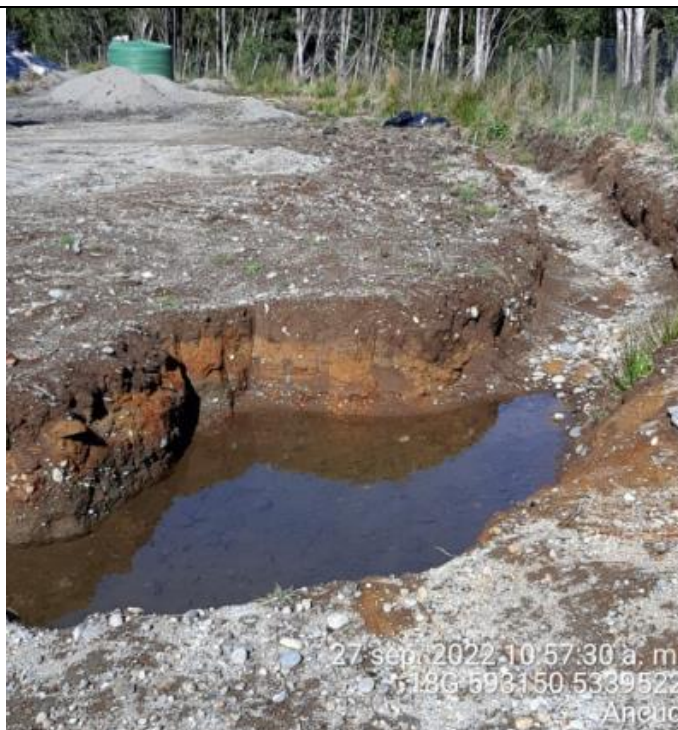
Fotografía N°30: Estado canales aguas lluvias