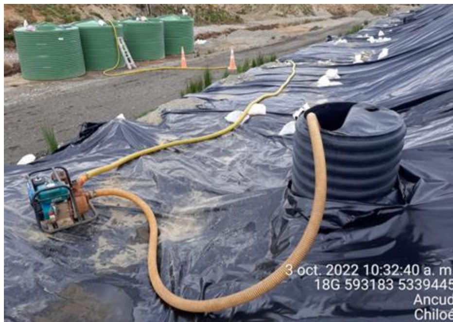
Fotografía N°9: Extracción de Lixiviados desde cámara C12 por personal municipal. Tomada: Lunes 03 de Octubre del 2022.