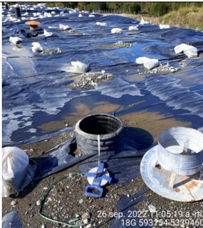
Fotografía N°17: Medición de Niveles de cámaras por Personal Municipal. Tomada: 26 de Septiembre del 2022.