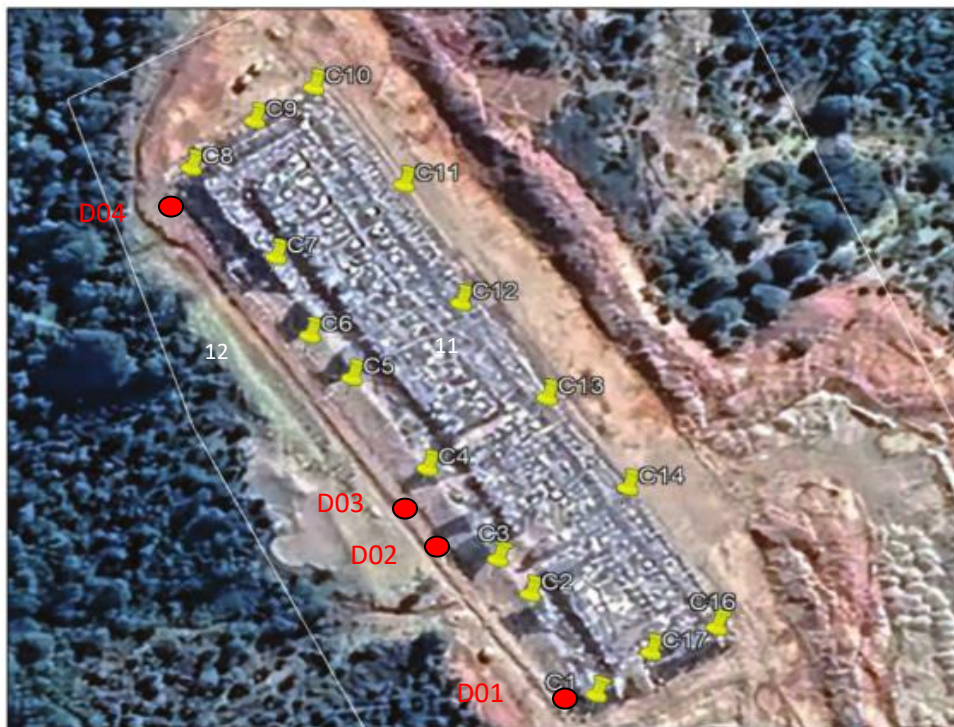
Fotografía N°16: Zanja Sanitaria N°1. Imagen Aérea I. Municipalidad de Ancud.

Se adjunta imagen donde se encuentra personal de Municipal realizando mediciones de cámaras de monitoreo de sobrecelda. Se realiza misma técnica de medición de