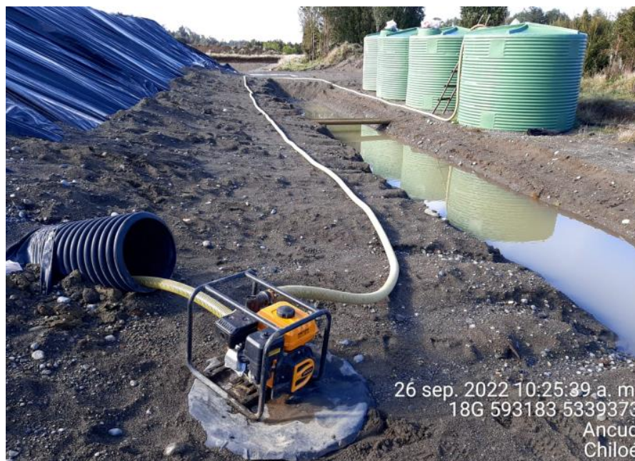
Fotografía N°1: Extracción de Lixiviados desde diagonal D02. Tomada: Lunes 26 de Septiembre del 2022.

A continuación, se presenta el registro fotográfico de las actividades de extracción del periodo del 26 de Septiembre al 09 de octubre del 2022.