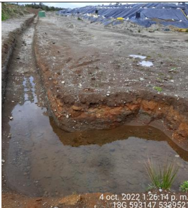
Fotografía N°36: Estado canales aguas lluvias