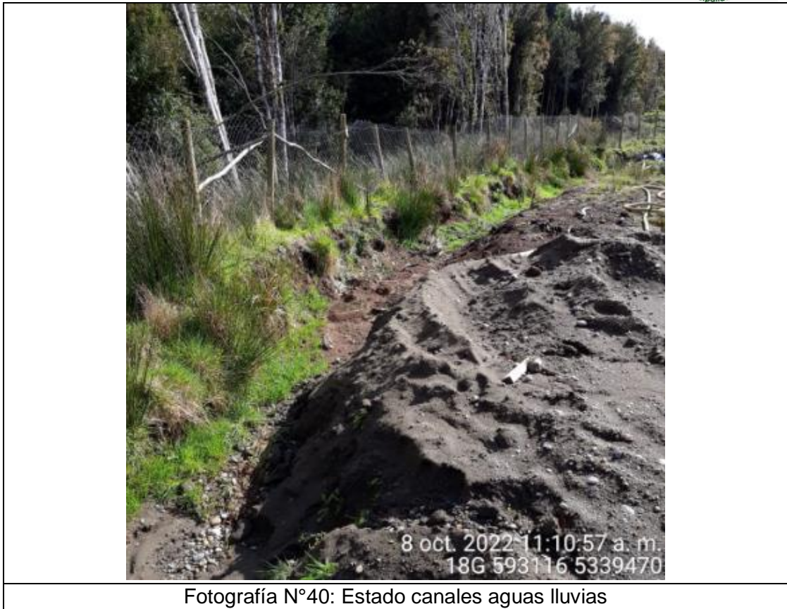
Fotografía N°40: Estado canales aguas lluvias

Los canales se encuentran limpios y las aguas lluvias se acumulan en el pozo ubicado en la zona norte recibiendo aportes provenientes de los canales perimetrales del lado este y oeste de la zanja. Se realizaron trabajos de mejora de los canales perimetrales producto de erosión por aguas lluvias. Se estuvo trabajando los días jueves 08 al sábado 10 de Septiembre, con maquinaria en el lugar. En las imágenes anteriores se puede ver los cambios y arreglos realizados. Se trabajó principalmente en el zona de adecuación y zona Oeste de los canales de aguas lluvias.