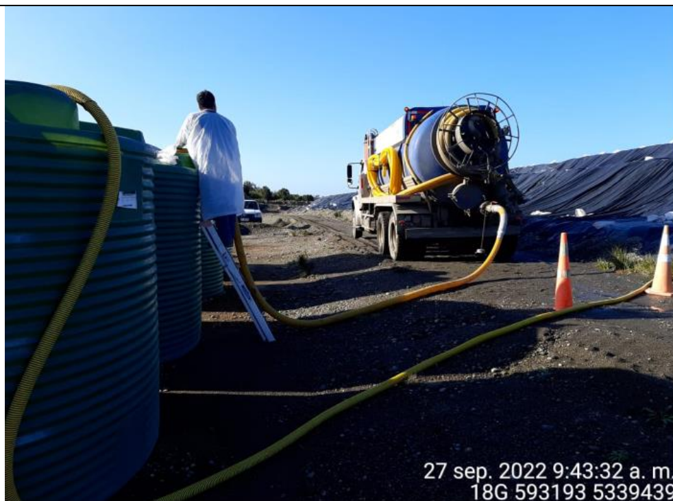
Fotografía N°3: Retiro de Lixiviados de empresa Tresol Tomada: Martes 27 de Septiembre del 2022.