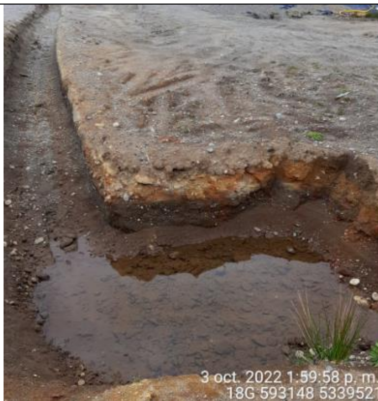
Fotografía N°35: Estado canales aguas lluvias