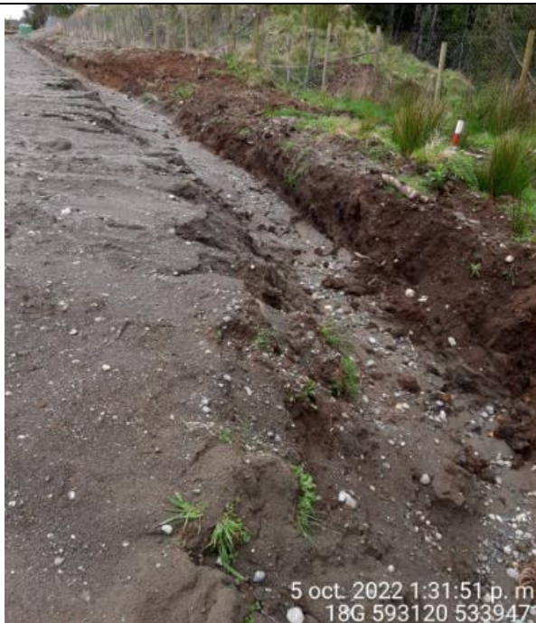
Fotografía N°37: Estado canales aguas lluvias