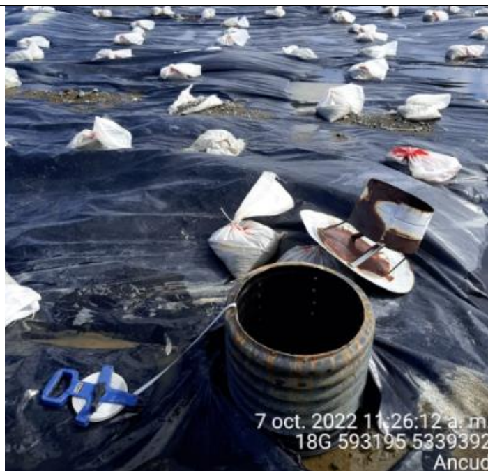
Fotografía N°27: Medición de Niveles de cámaras por Personal Municipal. Tomada: 07 de Octubre del 2022.