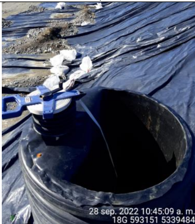
Fotografía N°19: Medición de Niveles de cámaras por Personal Municipal. Tomada: 28 de Septiembre del 2022.