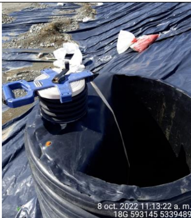
Fotografía N°28: Medición de Niveles de cámaras por Personal Municipal. Tomada: 08 de Octubre del 2022.