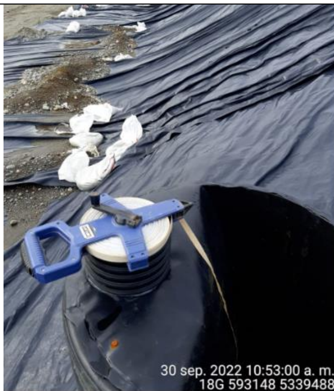
Fotografía N°21: Medición de Niveles de cámaras por Personal Municipal. Tomada: 30 de Septiembre del 2022.