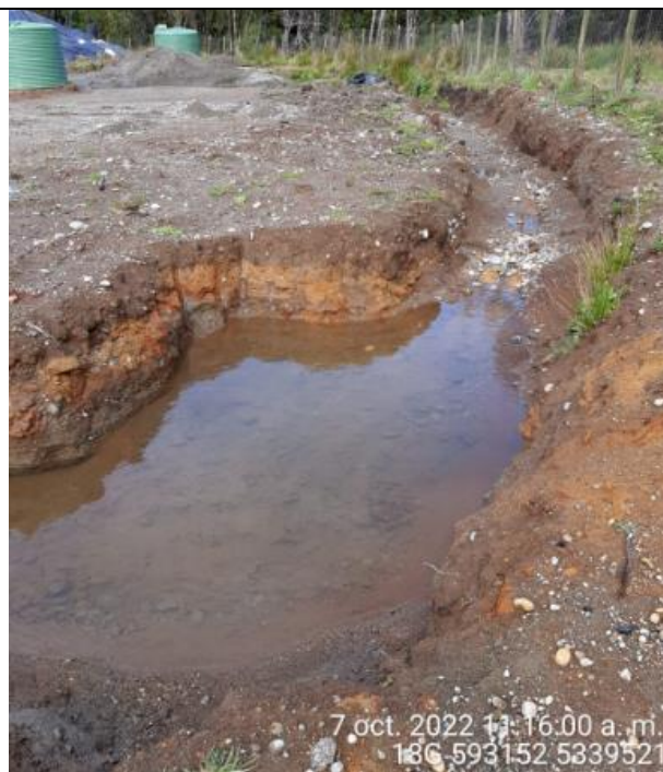
Fotografía N°39: Estado canales aguas lluvias