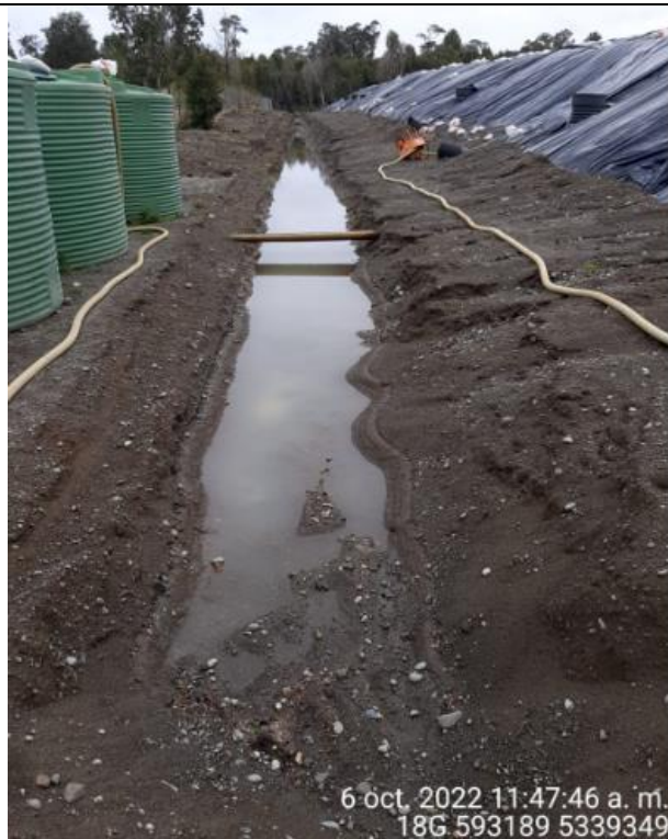
Fotografía N°38: Estado canales aguas lluvias