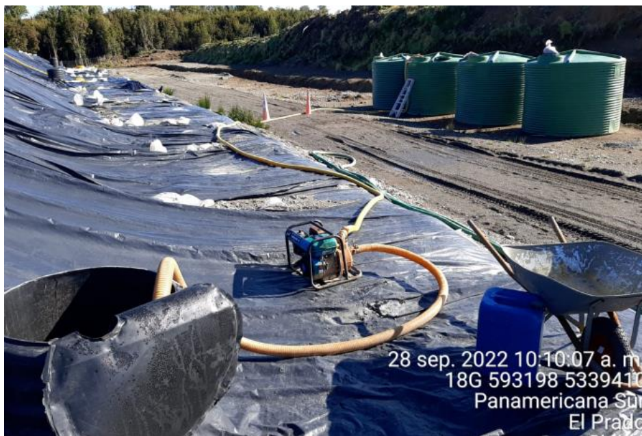
Fotografía N°5: Extracción de Lixiviados desde cámara C13 por personal municipal. Tomada: Miércoles 28 de Septiembre del 2022.