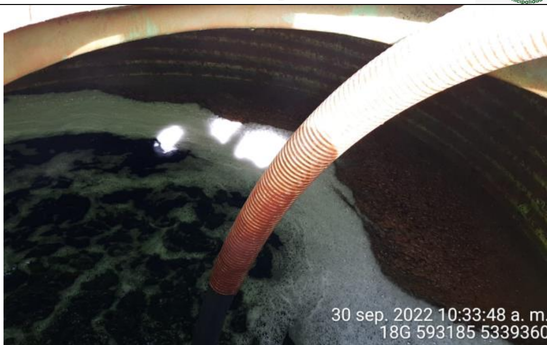
Fotografía N°8: Extracción de Lixiviados a estanque. Tomada: Viernes 30 de Septiembre del 2022.