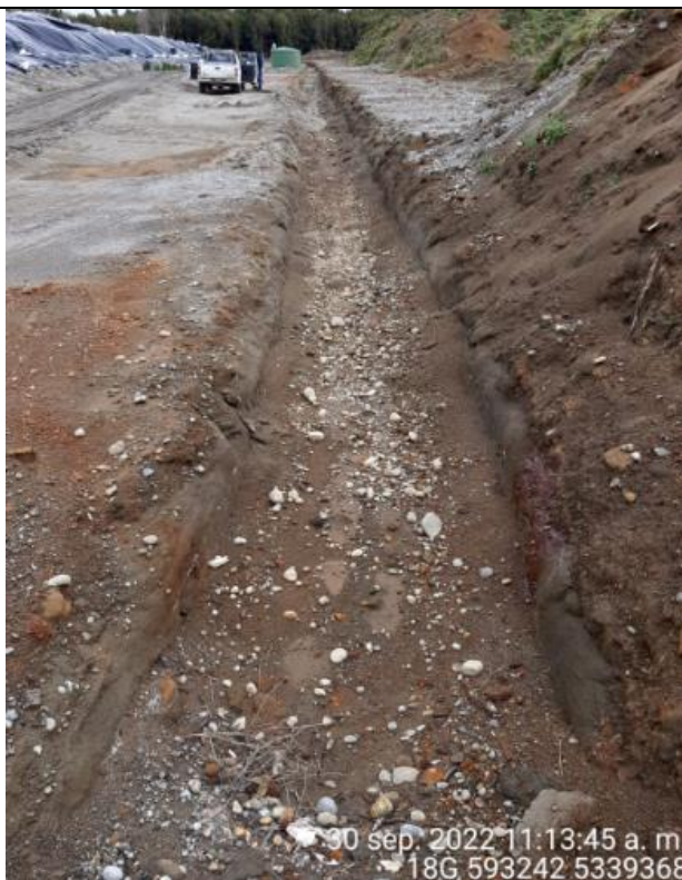
Fotografía N°33: Estado canales aguas lluvias